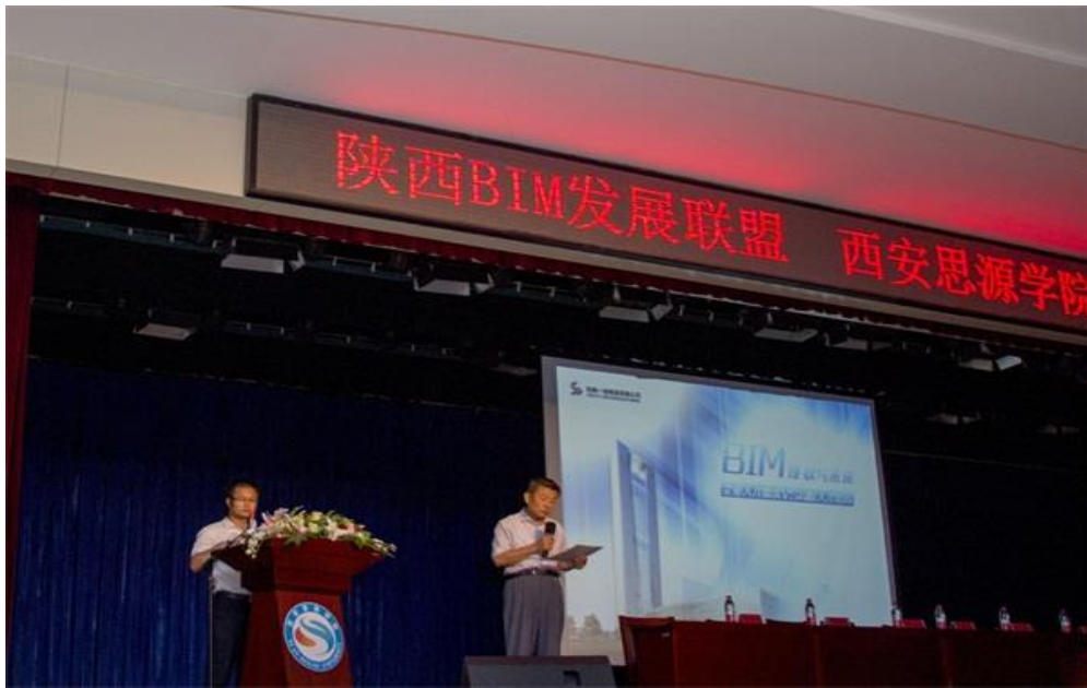
陕西BIM发展联盟高校行活动现场

两位专家专题报告会后与城建学院教师进行了座谈，主要探讨了BIM教学必须具备的硬件设施、师资培训、课程重点和教学方法方面的问题，我校教师均表示受益匪浅。