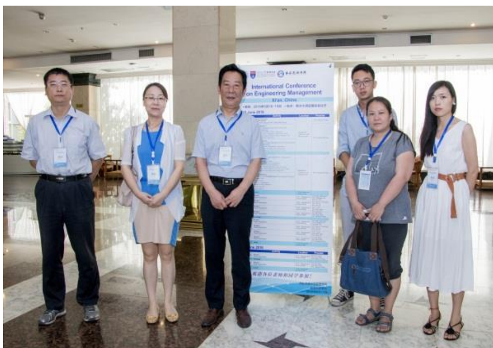
我校参会教师代表、工作人员与校领导合影

本次会议的召开迈出了我校承办国际学术交流活动的一大步，对加快我校工程管理相关学科专业建设有着重大的意义，也为我校教师在国际期刊发表高水平论文指明了方向。