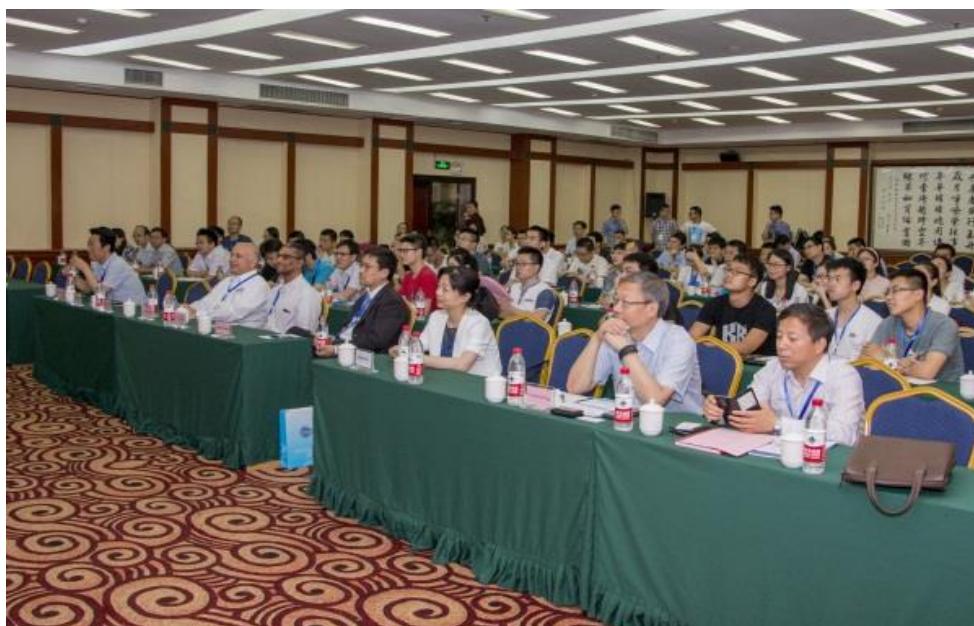
国际会议开幕式及主题报告会现场

由美国电气和电子工程师协会工程管理学报（IEEE Transaction on Engineering Management）编辑部主办，西安交通大学管理学院与我校共同承办的“工程管理在中国”国际学术会议暨期刊推介会，于2016年6月18日至19日在西安召开。